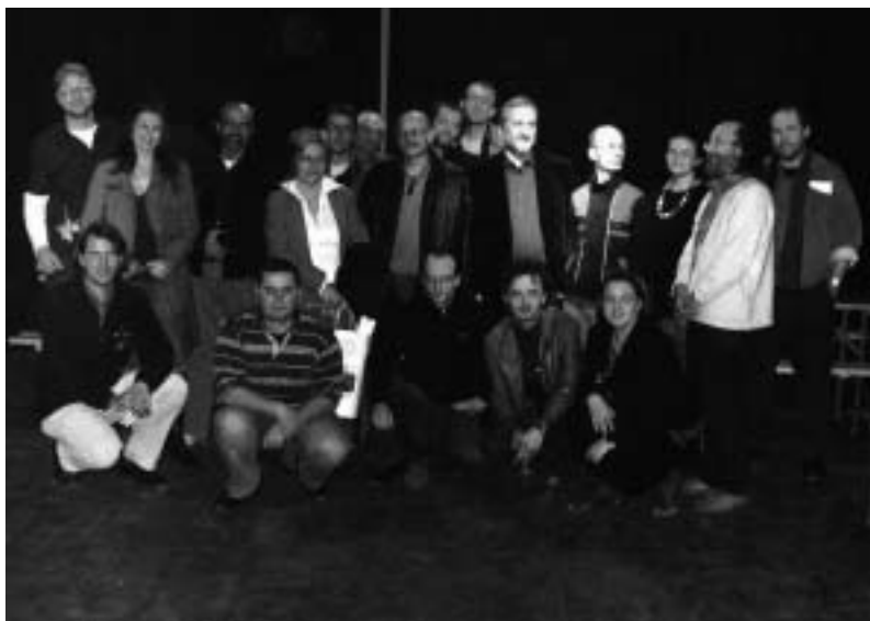
Ansambl u Njemačkoj