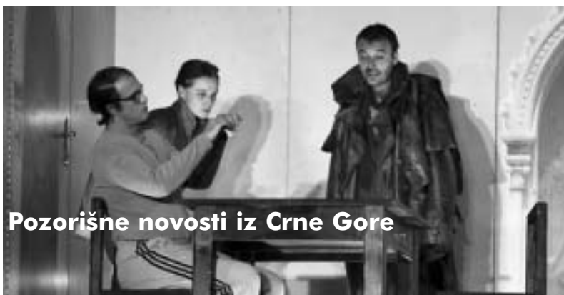
Pozorišne novosti iz Crne Gore

Zapaženo gostovanje na MESS-u: Nigdje nikog nemam