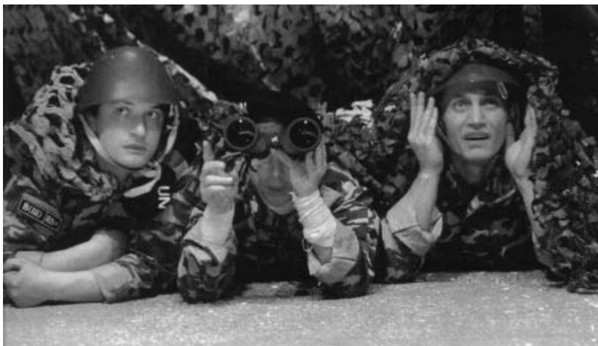
Zlatni vitez, Pukovnik ptica