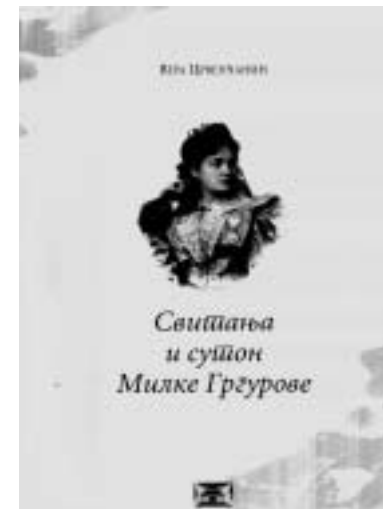
Izdavač: Muzej pozorišne umetnosti Srbije, Beograd, 2004.