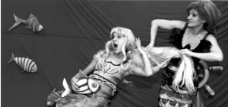
Mala Sirena, Pan teatar

Saradujemo sa nekim pozorištima iz Beograda, Paraćina, Šapca, Kruševca, Petrovca na Mlavi, Pančeva, Vršca. Oni gostuju na našoj sceni, a mi na njihovoj. U pregovorima smo da napravimo koprodukciju večernje predstave sa dva pozorišta. Te predstave će se igrati i na našoj i na njihovoj sceni. Takođe, saradujemo i sa pozorištima iz inostranstva (Toronto, Beč, Vilnius). Osim što gostujemo kod njih, organizujemo i njihov dolazak u naš grad, pa je naša publika često u prilici da vidi kako izgledaju predstave inostranih pozorišta. Upravo smo dogovorili da gostujemo na Festivalu dečijih pozorišta u Litvaniji (u maju), a