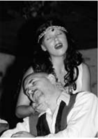
Scena iz Koštane vranjanskog pozorišta

Dvadeset i šesti Borini pozorišni dani uspješno su protekli u Vranju, od 21.10. do 31.10. 2006. Festival je otvorila gospođa Ljiljana Šop sekretar Ministarstva za kulturu republike Srbije, koja je iskoristila priliku da direktoru Pozorišta "Bora Stanković" najzad uruči Vukovu nagradu. Vukova nagrada je Pozorištu dodeljena još prošle godine, ali do sada nije svečano predana, zbog raspada SRGG.