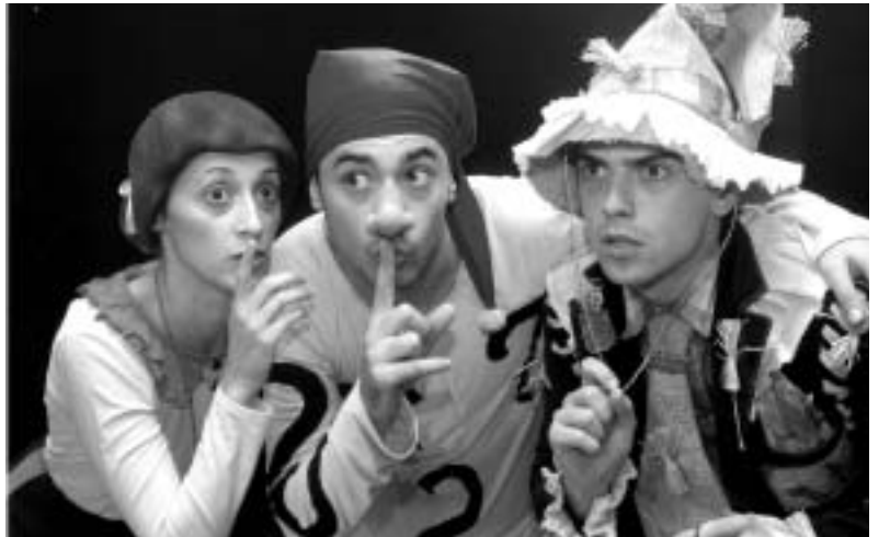
Ciciban, Pan teatar

Tada nam je cilj bio da nađemo prostor i oživimo u njemu pozorište koje će svojim predstavama zadovoljavati kriterijume publike. Svi znamo da to nije lako. Treba naviknuti publiku, naći sredstva za produkciju. Naravno, početak je težak, ali treba ga izdržati. Smatram da je deo ciljeva ostvaren, da smo se izborili za status naše scene i za njenu publiku. Naravno, ja nikad nisam