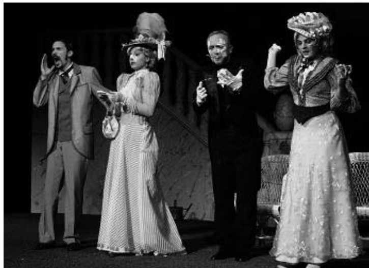
Iz predstave "Važno je zvati se Ernest"