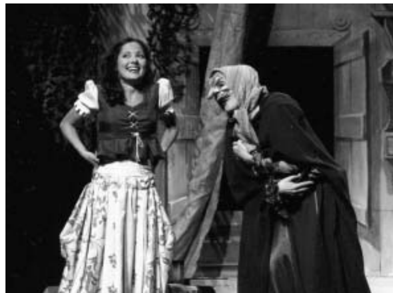
Iz predstave "Snežana i 7 patuljaka"

Od strane upravnika Pozorišta mladih, Tomislava Kneževića, smo pozvani za rad na predstavi "Beograd nekad i