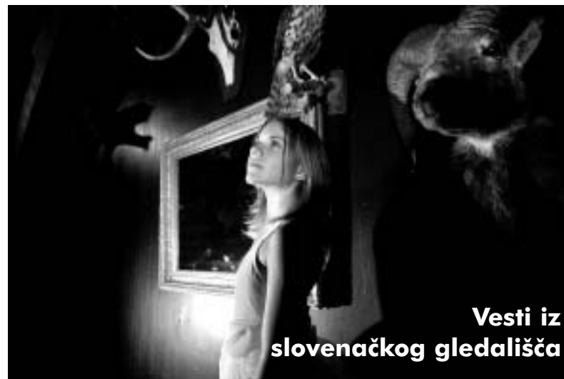
Sumrak bogova u SMG-u