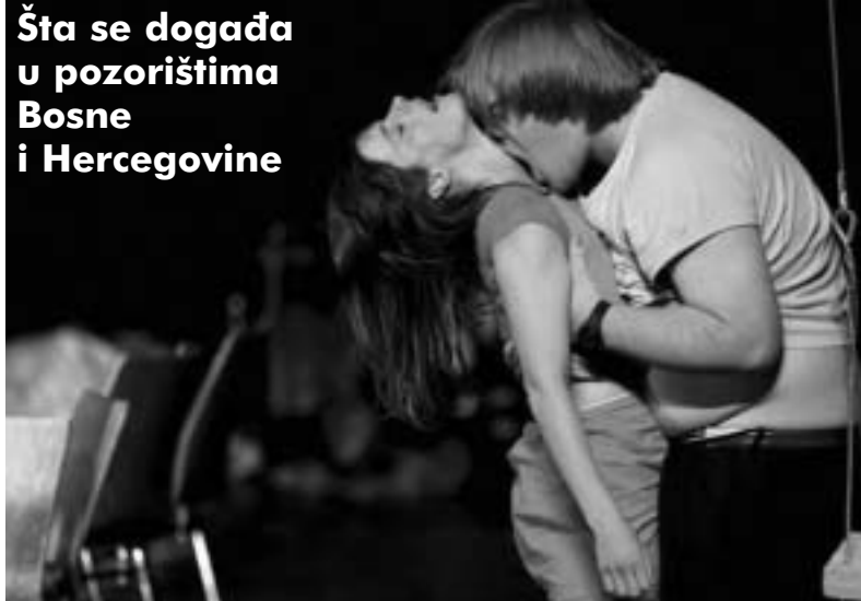
Najbolja režija na MESS-u: Tri sestre

noću, potražio svoj dobrovoljni egzil i samoću u pribežištu vlastite knjižare, odjednom postao i predmet zanimanja okoline.