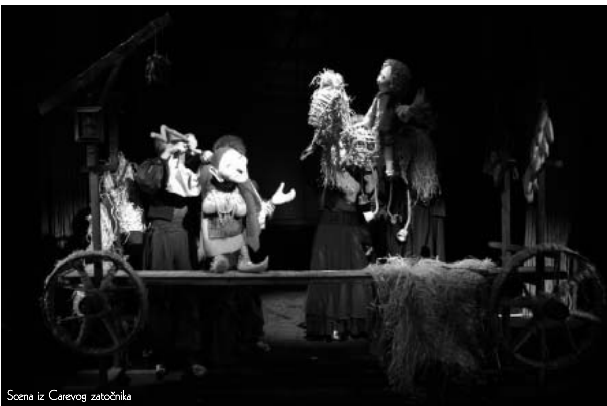
Scena iz Carevog zatočnika